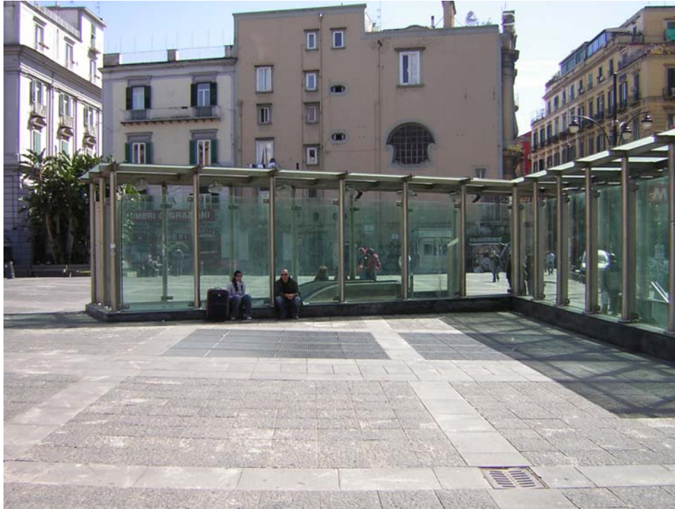
Figura 2 Le stazioni come occasione di riqualificazione della città storica: la stazione Dante