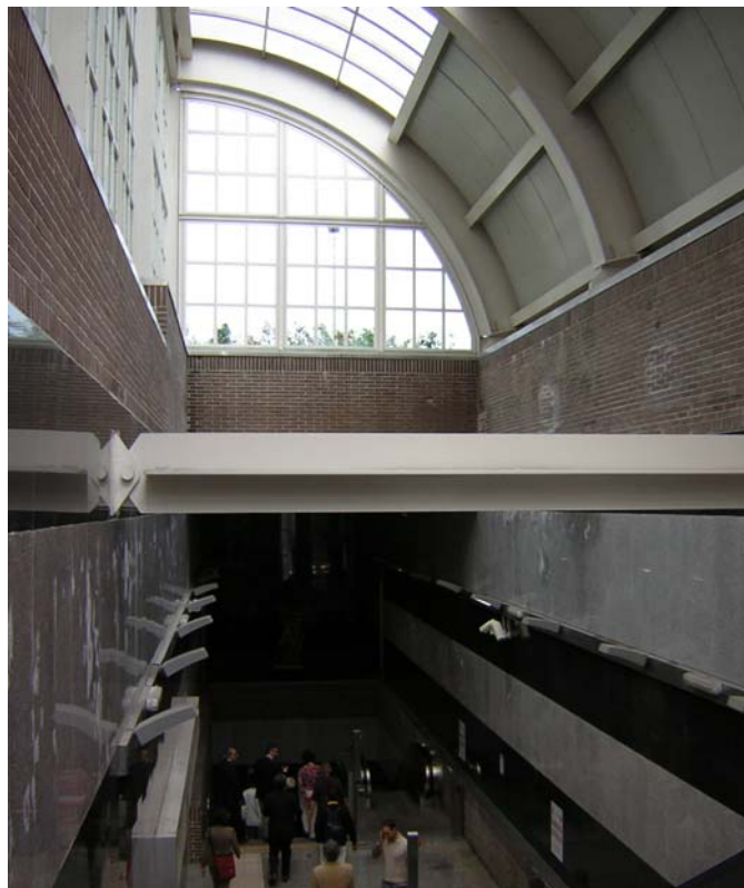
Figura 5 Le stazioni come elemento per lo sviluppo e la rigenerazione di aree periferiche: la stazione La Trencia