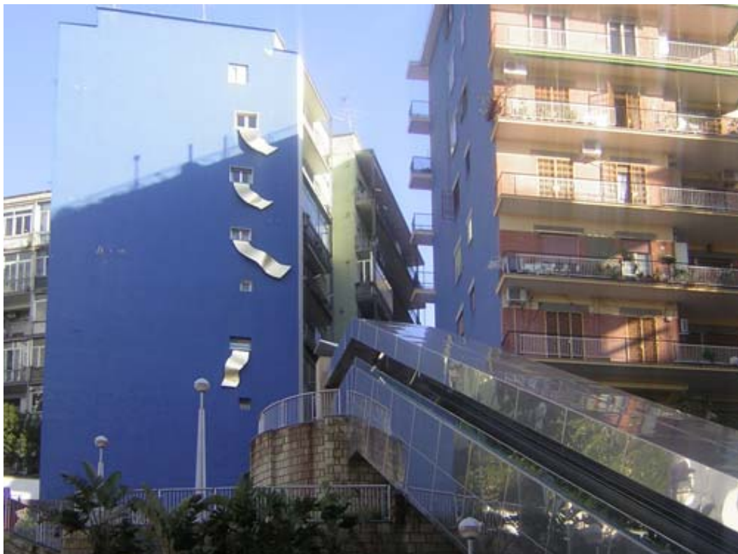
Figura 1 Le stazioni come occasione di riqualificazione della città storica: la stazione Salvator Rosa

Anche l'inaugurazione della stazione Dante (figura 2), avvenuta nel 2002, è stata affiancata alla riqualificazione della piazza in cui è inserita. Il progetto dell'arch. Gae Aulenti ha previsto la pedonalizzazione dell'intera piazza fatta eccezione per il tratto di via Toledo-Pessina ed una nuova pavimentazione. Le uniche architetture aggiunte sono le due uscite della metropolitana che sono costituite da vetrate che accolgono le scale e gli ascensori per accedere alla stazione sotterranea. Rispetto alla stazione di Salvator Rosa, l'intervento a P.zza Dante è stato meno complesso anche se di maggior impatto. La nuova stazione ha restituito un ampio spazio pedonale all'area più congestionata e densa della città.