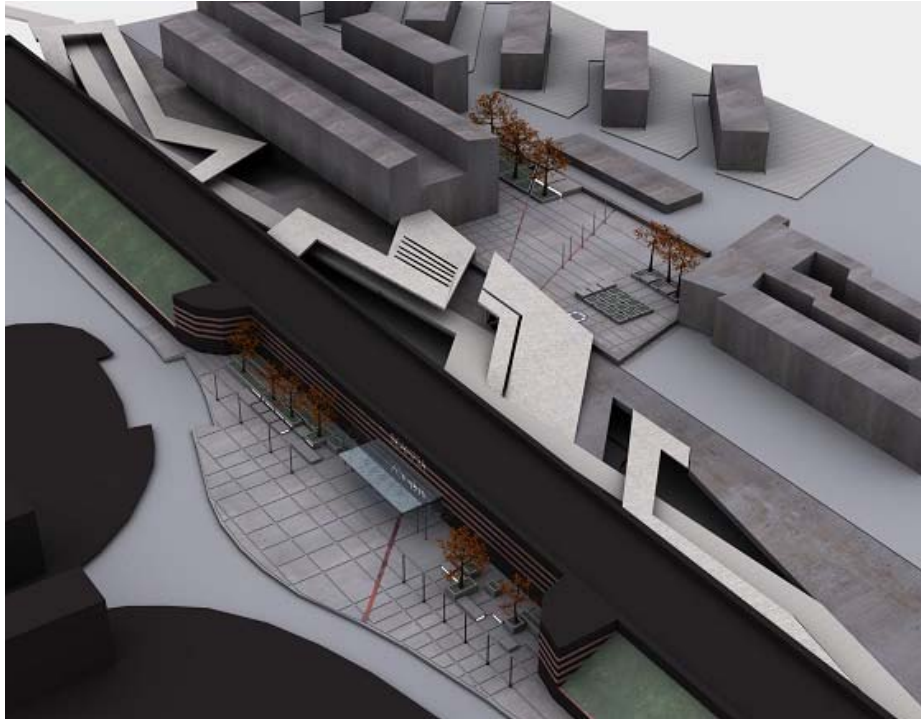
Figura 4 Le stazioni come elemento per lo sviluppo e la rigenerazione di aree periferiche: il nuovo progetto per la stazione di Scampia